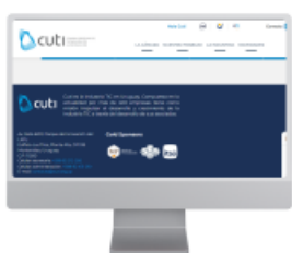
Presencia fija en la web de Cuti

Cada banner será incluido en un boletín de eventos o en uno de novedades, siendo condición no incluir dos banners distintos en un mismo mes.