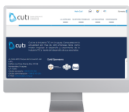
Presencia fija en la web de Cuti

Cada banner será incluido en un boletín de eventos o en uno de novedades, siendo condición no incluir dos banners distintos en un mismo mes.