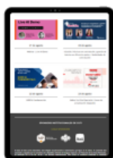
Presencia fija en los boletines