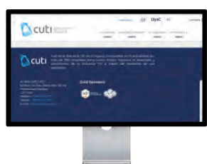
Presencia fija en la web de Cuti

Cada banner será incluido en un boletín de eventos o en uno de novedades, siendo condición no incluir dos banners distintos en un mismo mes.