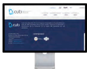
Presencia fija en la web de Cuti

Cada banner será incluido en un boletín de eventos o en uno de novedades, siendo condición no incluir dos banners distintos en un mismo mes.